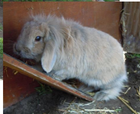
Dit was Dibbes.....